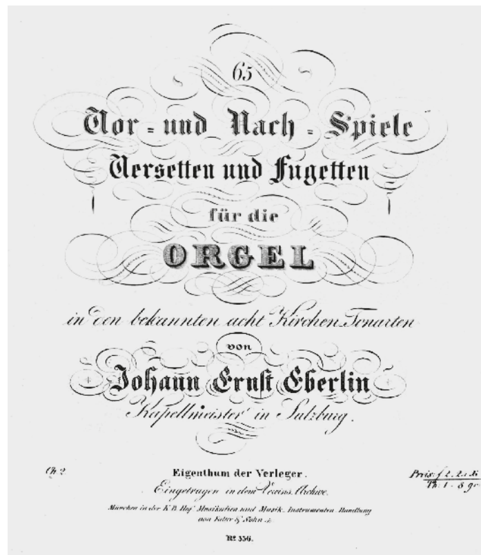
Johann Ernst Eberlin : page d'ouverture du manuscrit.