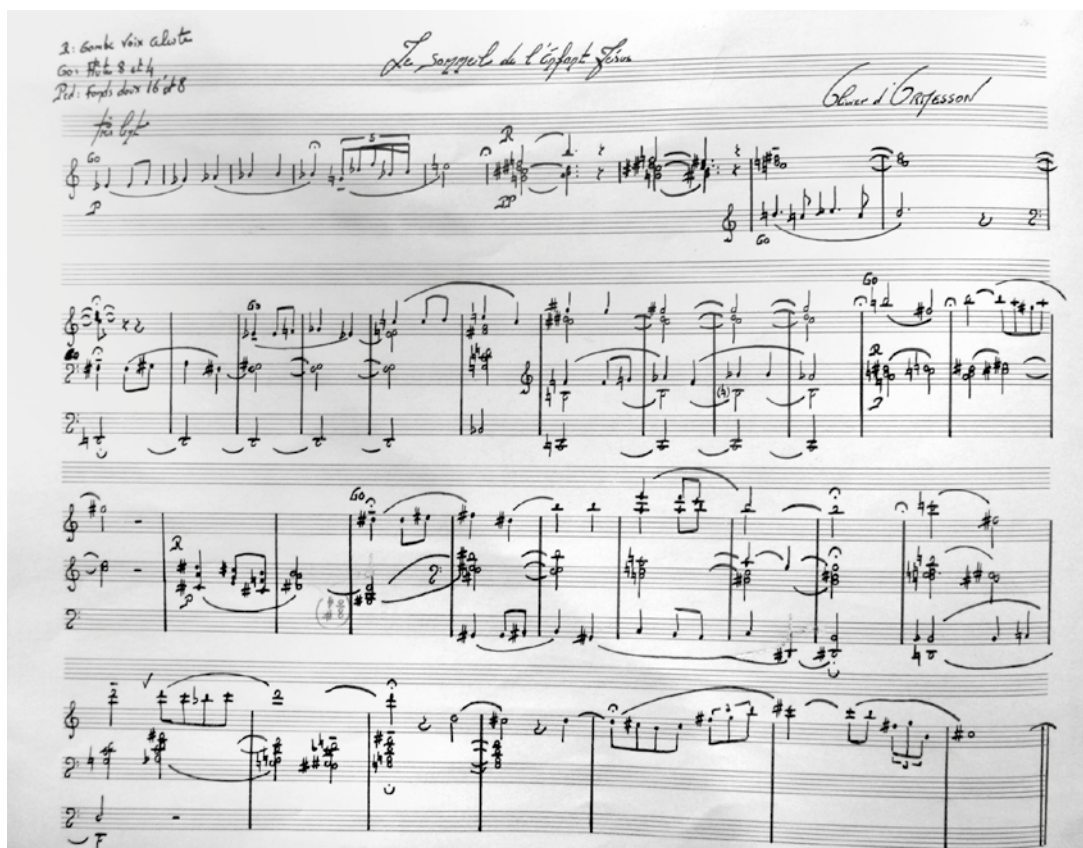
Manuscrit préparatoire du Sommeil de l'Enfant Jésus d'Olivier d'Ormesson