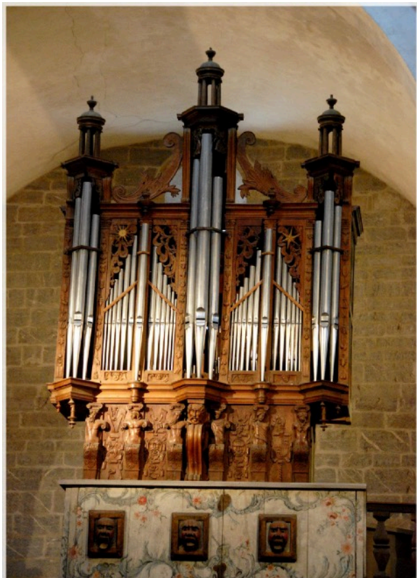
Orgue Anonyme de Saint-Savin