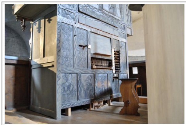
Orgue Anonyme de Saint-Savin