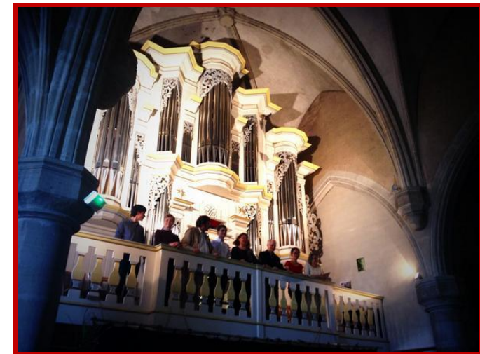
Eglise de Pontaumur, Orgue François Delhumeau (2004)