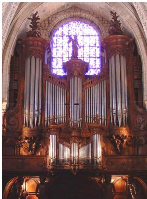
Angers - Cathédrale Cavaillé-Coll 1873, Beuchet-Debierre 1959