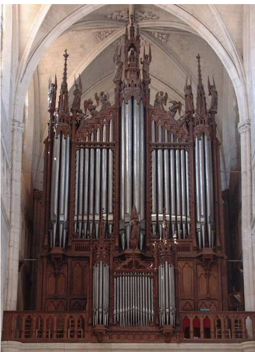
Luçon - Cathédrale Cavaillé-Coll 1855, Schwenkedel 1968